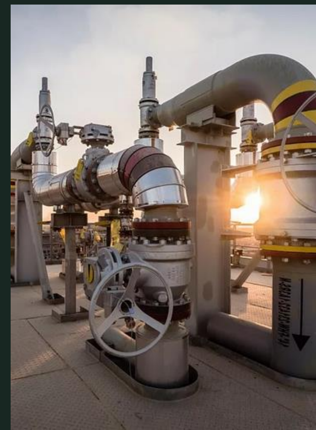
НЕФТЬ И ГАЗ