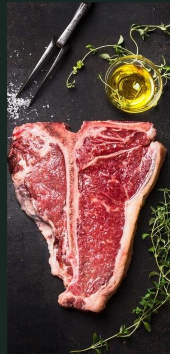
МОЛОЧНАЯ И МЯСНАЯ ПРОМЫШЛЕННОСТЬ